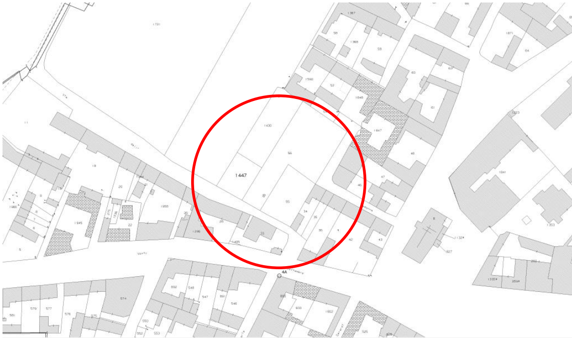
Estratto di mappa catastale Foglio n° 17