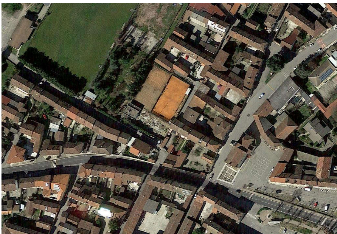
Vista aerea area sportiva di Frassineto Po